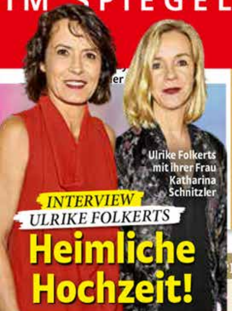
Ulrike Folkerts mit ihrer Frau Katharina Schnitzler