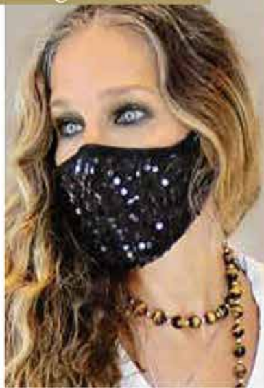
WOW Sarah Jessica Parkers (56) Augen funkeln mit der Maske des US-Stars um die Wette

Augenschatten mit einem leichten, nicht-fettenden Concealer abdecken. Mit dem Eyeliner-Stift einen Lidstrich entlang des Wimpernkranzes ziehen. Den Lidschatten passend zum Outfit wählen und mit einem Pinselchen verblenden. Wimpern tuschen.