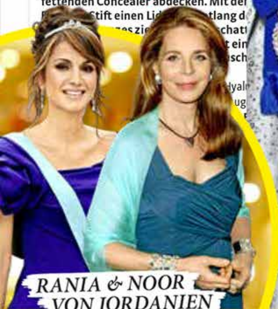
RANIA & NOOR VON JORDANIEN

GALANDE PRÄSENTATIONEN hatte mit einem reinen, nicht fettenden Concealer abdecken. Mit der Stift einen Lid-Liner entlang d es zie sch