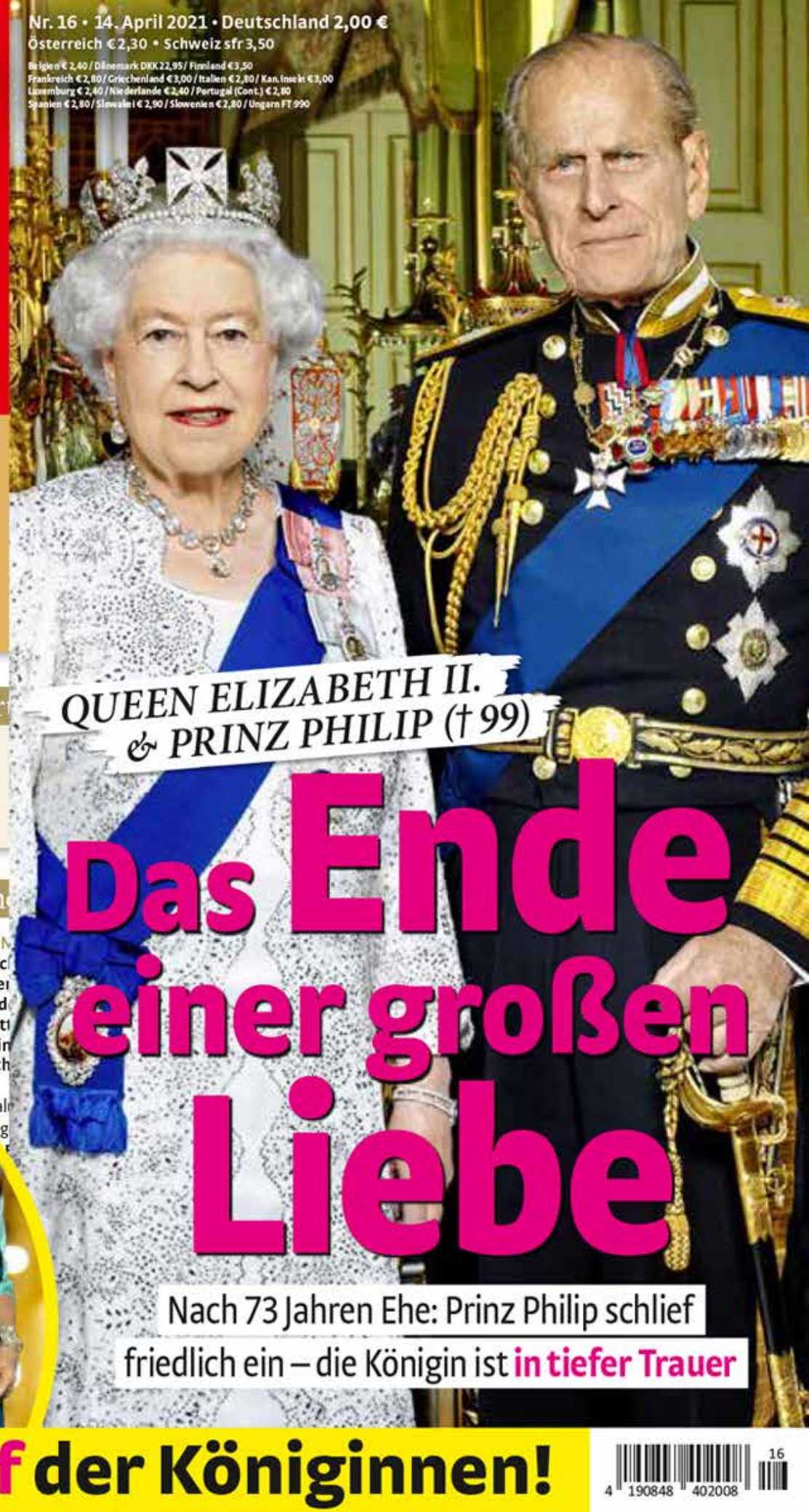
QUEEN ELIZABETH II. & PRINZ PHILIP († 99)