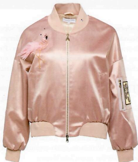
PATRIZIA PEPE Bomberjacke aus der Special Edition #NOONELIKEYOU für 379,- Euro