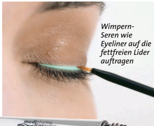
Wimpern-Seren wie Eyeliner auf die fettfreien Lider auftragen

Mit Koffein: „Wimpern Booster“, ca. 30 €, Medipharma Cosmetics